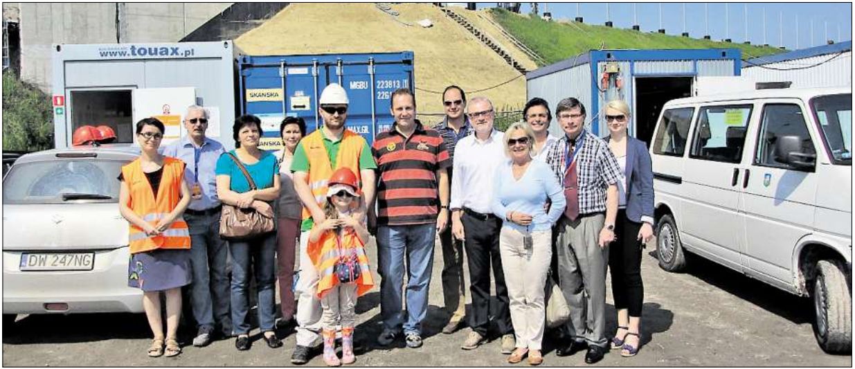
Beim Besuch in der polnischen Partnerstadt Brzeg Dolny schauen sich die Gäste aus Barsinghausen unter anderem den Baufortschritt an der neuen Oderbrücke an.

Barsinghäuser Delegation besucht die Feierlichkeiten in der polnischen Stadt Brzeg Dolny