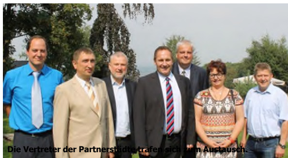
Die Vertreter der Partnerstädte trafen sich zum Austausch.